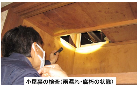
小屋裏の検査(雨漏れ・腐朽の状態)