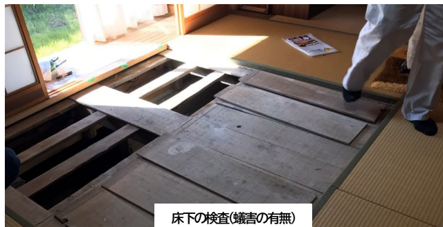
床下の検査(錆害の有無)